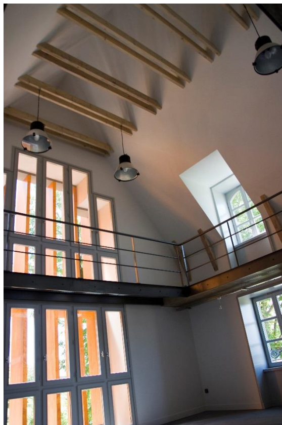
Vue de l'atelier et de la passerelle de la mezzanine